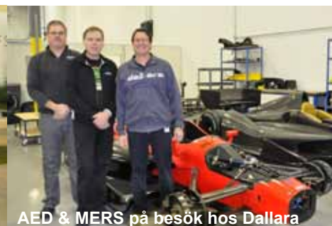
AED & MERS på besök hos Dallara